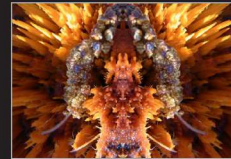
Almut Martiny, gespiegelte Fotografie