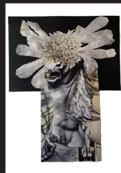
Elke Martiny, Collage/Fotografie