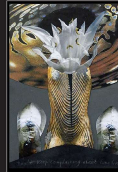
Elke Martiny, Collage/Fotografie