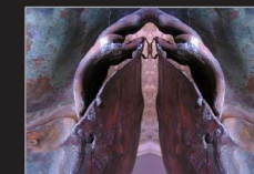
Almut Martiny, gespiegelte Fotografie