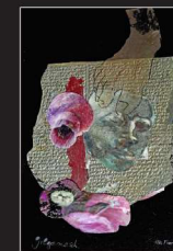
Elke Martiny, Collage/Fotografie