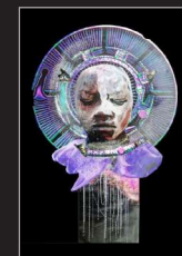
Elke Martiny, Collage/Fotografie