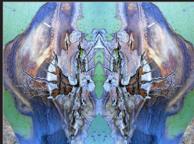
Almut Martiny, gespiegelte Fotografie