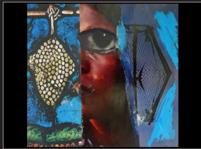
Elke Martiny, Collage/Fotografie