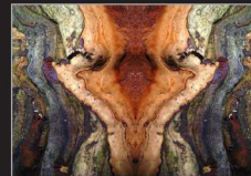
Almut Martiny, gespiegelte Fotografie