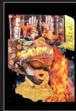
Elke Martiny, Collage/Fotografie