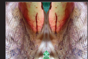
Almut Martiny, gespiegelte Fotografie