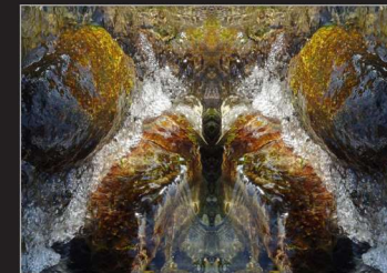
Almut Martiny, gespiegelte Fotografie