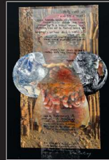
Elke Martiny, Collage/Fotografie