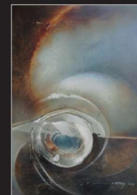
"Espada" Öl/Foto/Papier/Leinwand, 80x60cm, 2012