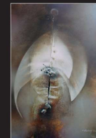
"Imago" Öl/Foto/Papier/Leinwand, 70x50cm, 2012