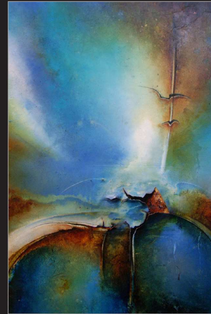
"Rissig" Öl/Foto/Papier/Leinwand, 100 x 80 cm, 2009