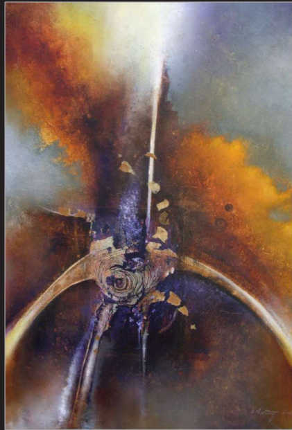
"Herbst" Öl/Foto/Papier/Leinwand, 100 x 80 cm, 2008