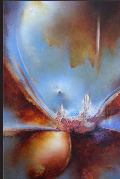
"Traumzeit" Öl/Foto/Papier/Leinwand, 100 x 80 cm, 2008