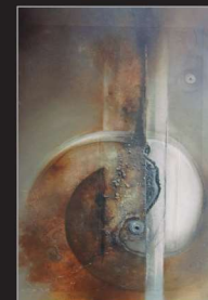
"Verankert" Öl/Foto/Papier/Leinwand, 80x60cm, 2012