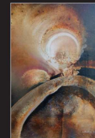
"Eisenstein" Öl/Foto/Papier/Leinwand, 70x50cm, 2012