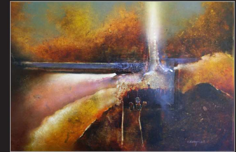
"Metropolis", Öl/Foto/Papier/Leinwand, 80 x 100 cm, 2009