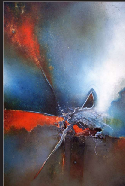
"Voliere" Öl/Foto/Papier/Leinwand, 100 x 80 cm, 2009

Künstlervereinigung Pupille, Hanau (seit 2003 zweimal jährliche Themenausstellungen); „Kunst am Grenzweg“, Kunst- und Kulturwochenende in Großostheim/Schafheim (2003, 2006, 2009, 2012); HöchstArt II, Frankfurt-Höchst (2007); Artflex-Messe, Strudelbachhalle, Weissach/Stuttgart (2010, Katalog); Salle Roger Loury, Anould-Frankreich (2011); MenschWerk, BayWa, Hösbach (2013)